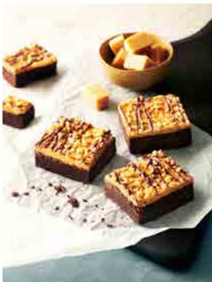
CARAMEL MET PURE CHOCOLADE