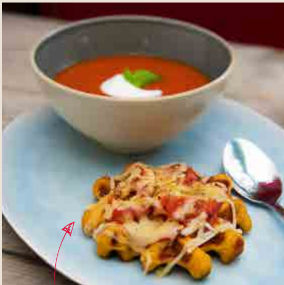
Server je soep eens met een kleine pizzawafel!