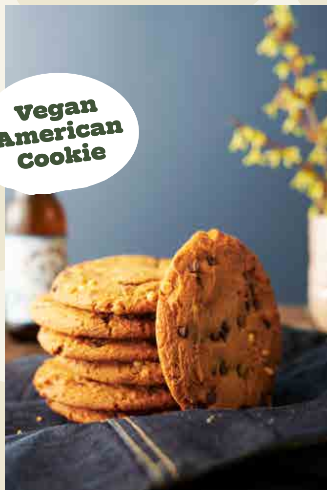
Vegan American Cookie

Een American cookie met de volle smaak van chocolade gevuld met pure chocolade stukjes.