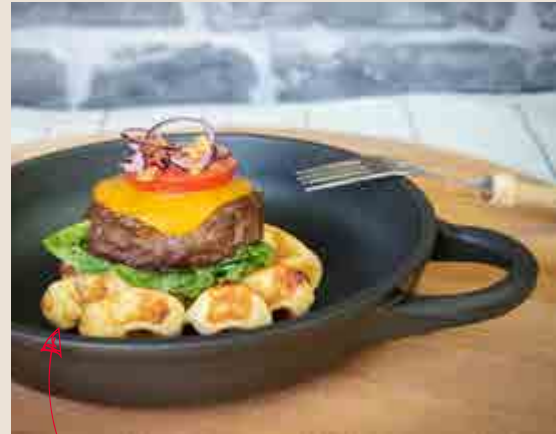
The waffle burger! Hoe gaaf is dit!