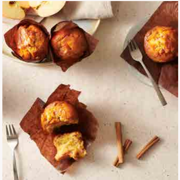
APPEL KANEEL MUFFIN