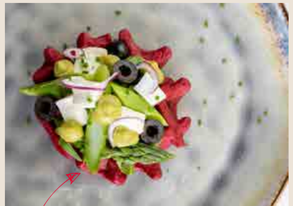
Rode biet wafel met groene asperge, feta, olijven en avocado crème