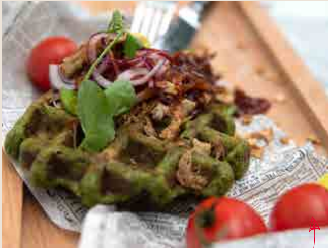
Boerenkoolwafel met pulled pork en bbq-saus

KANT-EN-KLAAR BESLAG WAARMEE JE IN EEN HANDOMDRAAI DE LEKKERSTE GROENTEMUFFINS & -WAFELS MAAKT.