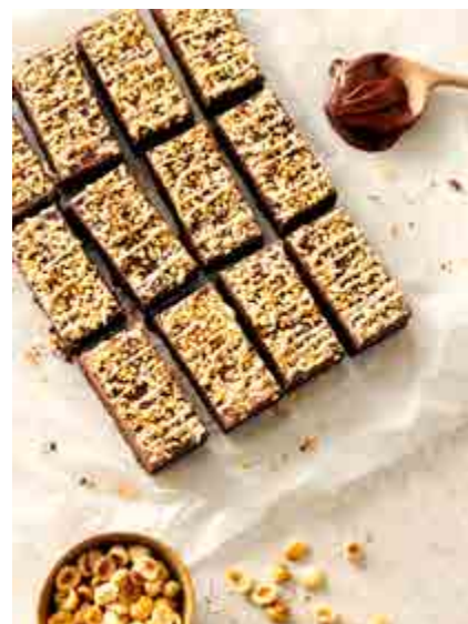
NUTELLA EN HAZELNOOT