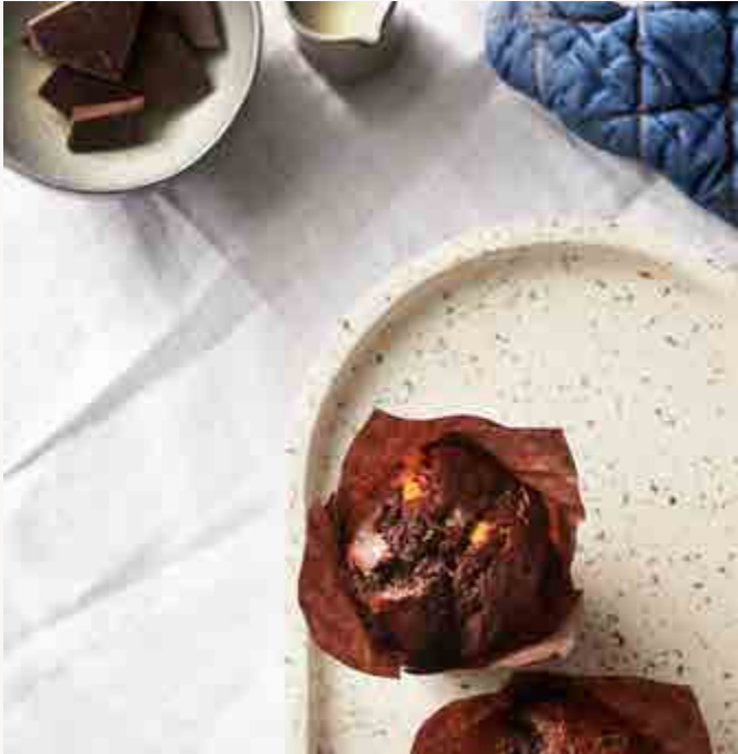
DOUBLE CHOC MUFFIN