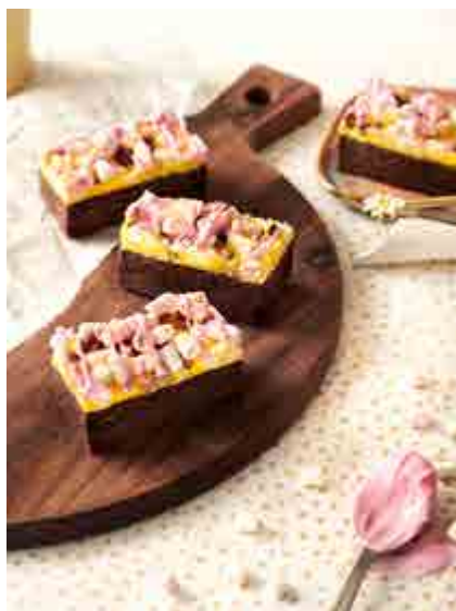
MARSMELLOW ROCKY ROAD