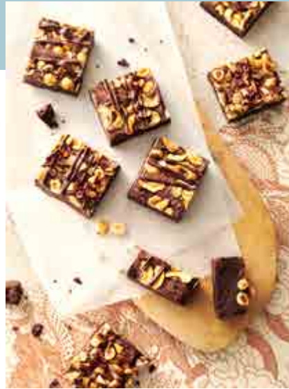
NOTEN MET CHOCOLADE