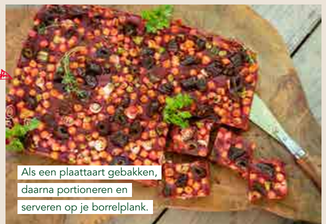
Bietenbeslag met geitenkaas, vrijen en lente-ui.

Als een plaattaart gebakken, daarna portioneren en serveren op je borrelplank.