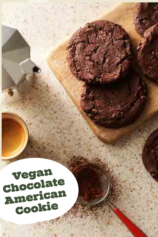
Vegan Chocolate American Cookie

Een American cookie met de volle smaak van chocolade gevuld met pure chocolade stukjes.