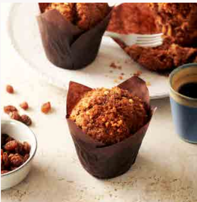
SPICE & RAISIN