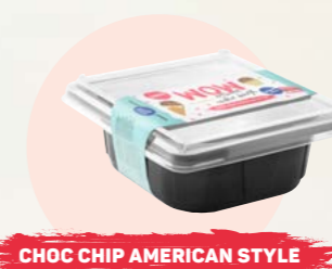
CHOC CHIP AMERICAN STYLE