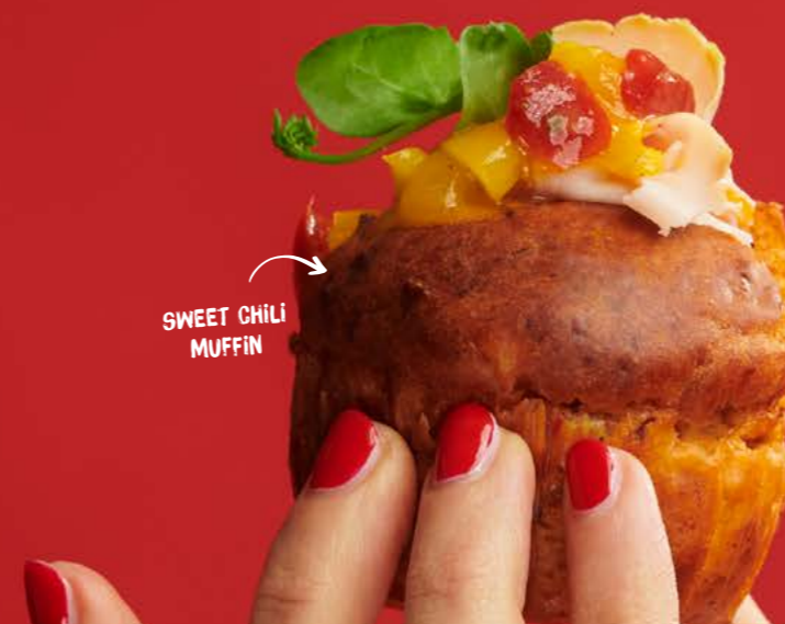
SWEET CHILI MUFFIN

Per 12 stuks verpakt in tray. 2 trays in doos, diepvries.